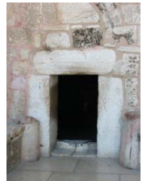
L'entrée de l'église de la Nativité

Nous ferons la même réflexion lors de notre visite à Bethléem de l'église de la Nativité. Et en Palestine la situation semble pire encore. Nous leur souhaitons de tout cœur que la paix puisse devenir réalité. C'est ce que tous (Israéliens et Palestiniens) nous ont dit souhaiter. Tout le monde y gagnera. On a déjà noté une tension moindre dans les deux états.