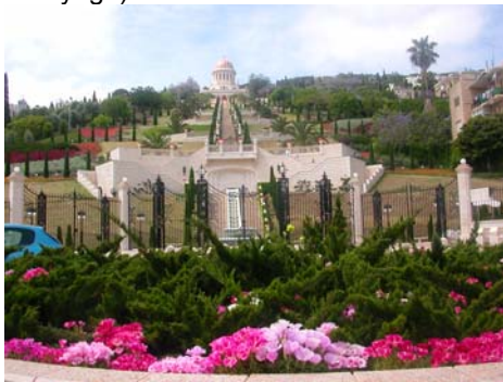
Les jardins « perses »

Tous les jours ce fut visites (Haïfa : la ville, le port militaire, l'université, les jardins « perses » toujours aussi bien fleuris ; les villages Druzes ; Césarée) repas amicaux, célébrations (Journée des Morts, création de l'état d'Israël) ; découverte de Tirat-Carmel (en particulier pour ceux dont c'était le premier voyage).